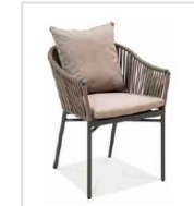
opcion de silla exterior