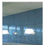
Lacobel blue pastel