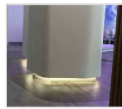
Forro de Corian con led inferior