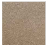
Coverlam Limestone marron(efecto arena)