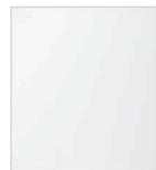
Lacobel WHITW PURE